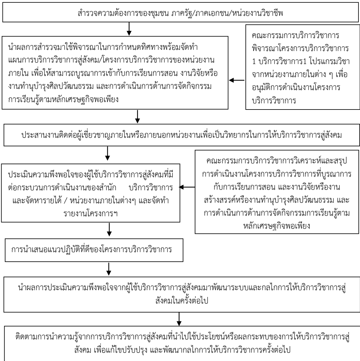
ภาพที่ 1 แสดงขั้นตอนระบบและกลไกการบริการวิชาการสู่สังคม