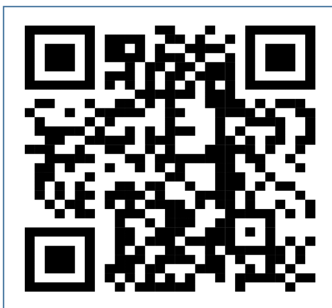
ดาวนัโหลดคู่มือ